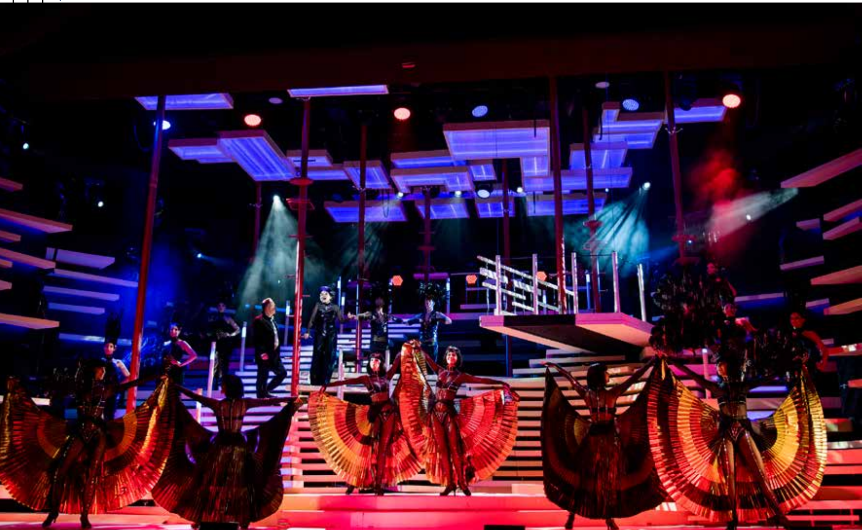
Arthur KOPIT–Maury YESTON–Mario FRATTI NINE Rendező / Director: BALÁZS Zoltán Budapesti Operettszínház, 2021